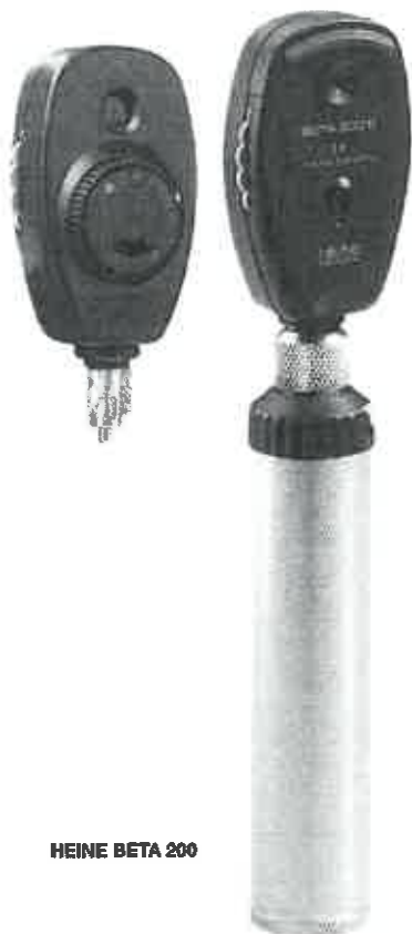
HEINE BETA 200